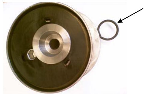
Εικ. 2 Έκδοση τροχαλία χωρίς κοπίλια